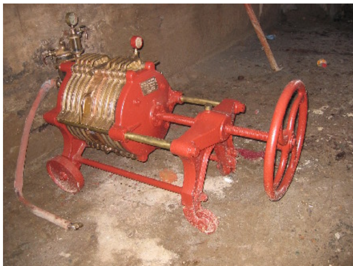
Fig. 03 – Dechaineux-bierfilter in de voormalige brouwerij-mouterij Sint-Joris in Reningelst.

De Ateliers de construction H. Dechaineux et Cie (Successieur de J. Ponty et Cie) werden in 1888 door J. Ponty opgericht. Aanvankelijk waren de werkhuizen en de bureaus gelegen in de Frontispiesstraat te Brussel 1 . Omstreeks 1905 verhuisde het bedrijf Dechaineux naar de Engelenbergstraat 23-27 en Leopold II-laan 178 te Brussel 2 . Voor zijn afzet in Frankrijk werkte het bedrijf samen met de Usines H. Ponty in Tourcoing 3 . Het fabriceerde vooral bottelinstallaties voor bier, water en melk, toestellen om flessen te weken, te reinigen en te spoelen en machines voor de aanmaak van sprankend water en limonades. Ook met andere toestellen zoals apparaten om gist te zuiveren en te bewaren pakte het bedrijf uit in vakbladen 4 . In het interbellum verdeelde Dechaineux ook Mouvex-pompen 5 . Omstreeks de jaren 1930 bracht het bedrijf met succes de wasmachine Miller-Hydro op de markt 6 . Een belangrijk product van Dechaineux in de jaren 1970 waren ondermeer zijn sproeiers voor de mechanische reiniging van lagertanks 7 . Machines van J. Ponty & C ie stonden ondermeer opgesteld