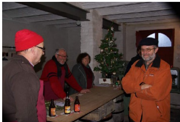
Fig. 02 – Kerst in de Snoek

Ondanks het zeer barre winterweer, waarbij het Mout- & Brouwhuis de Snoek bijna niet bereikbaar was, was de Kerstdrink best gezellig. De vele kwalitatieve kerstbieren en de overheerlijke culinaire hapjes uit de regionale keukens zorgden ervoor dat de aanwezigen zich maar al te graag lieten insneeuwen. Kortom, zeker voor herhaling vatbaar. Om de weergoden wat indachtig te zijn dient zich misschien wel een andere moment aan maar daarover meer in een volgende Brouwbulletin.