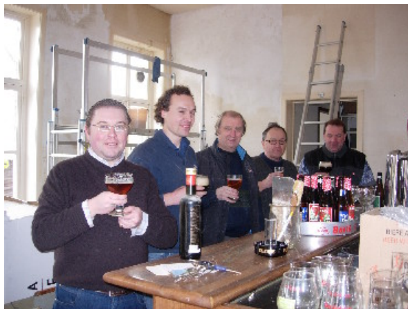
Fig. 01 – Enkele vrijwilligers tijdens een welverdiende pauze.

Stilaan komt de lente in het land en werpen de eerste zonnestrallen ook hun licht binnen in het Mout- & Brouwhuis de Shoek. Met vereende kracht voeren vrijwilligers sinds enkele weken tijdens hun vrije zaterdagen belangrijke werken uit aan het museum-van-de-dorst. Zij wachten immers niet op Godot.