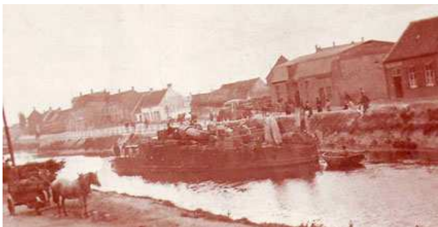
Een Franse kanonneerboot op patrouille door Fortem passeert voorbij brouwerij De Ster.