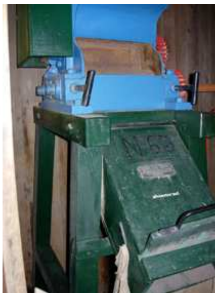
Illustratie links: briefhoofd van de firma Feys-Van Hee in Veurne (1931).