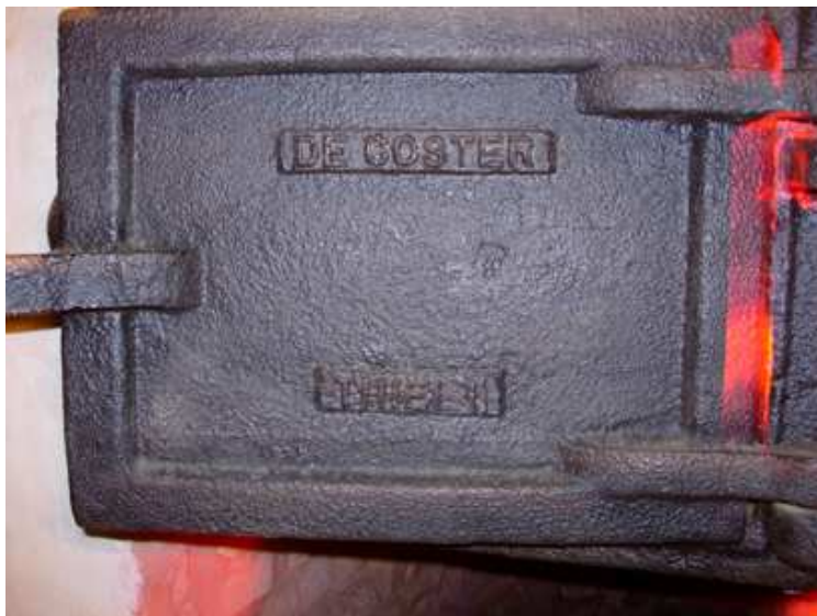
Fig. 06 – Het overdeurtje uit de gieterij De Coster-Van de Velde in Tielt.

Een voor het West-Vlaamse brouwbedrijf belangrijk toeleveringsbedrijf was het constructieatelier De Coster-Van de Velde in Tielt. In het Mout- & Brouwhuis de Snoek herinneren vandaag nog de gietijzeren overdeurtjes onder de kopen brouw- en waterketels nog aan dit bedrijf. Ook op andere brouwerijsites zijn van deze firma nog materiële sporen bewaard, zoals een gietijzeren koelschip in de brouwerij Roelandts in Wakken.