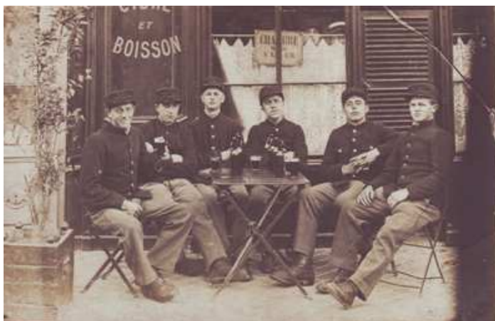
Fig. 02 - Tentoonstelling "'Goed genoeg voor de soldaat. Het verhaal van de dorst in de Grote Oorlog'. Eén van de vele sprekende fotos: Soldaten op verlof in Parijs, voorjaar 1915.