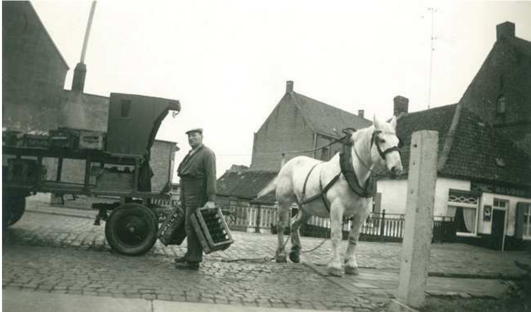
Fig. 08 - Toen geen vreemde combinatie. Een temperamentvol Boulonnais-paard dat zich trots naar de fotograaf wendt. Als veulen werd het over de grens gesmokkeld door een ijverige 'beestemarchand' want het ras werd vooral in de streek van Boulogne-sur-Mer gefokt.