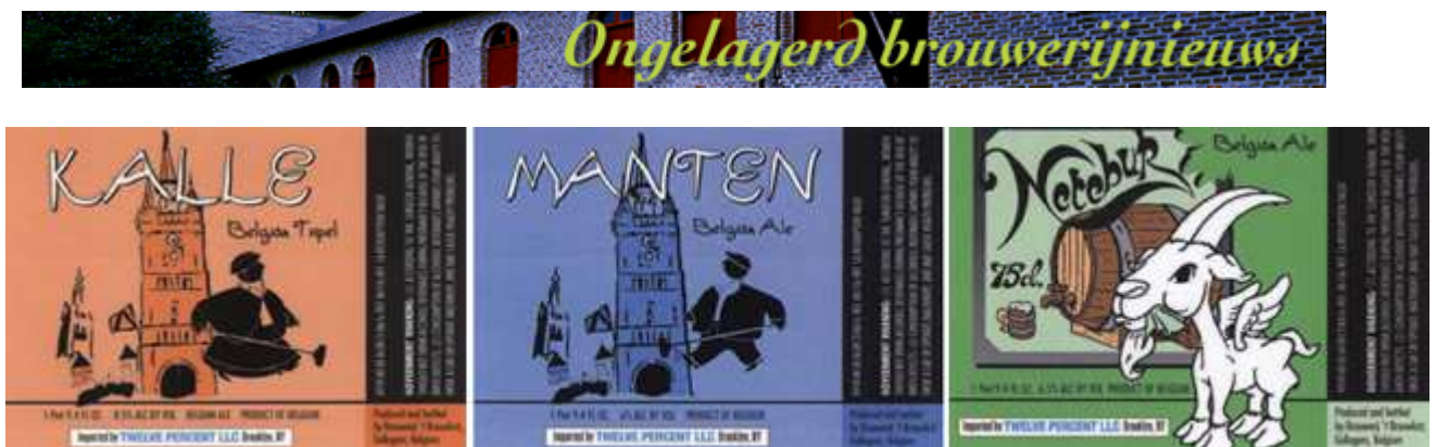
Fig. 07 - Manten, Kalle en Netebuk op etiket.