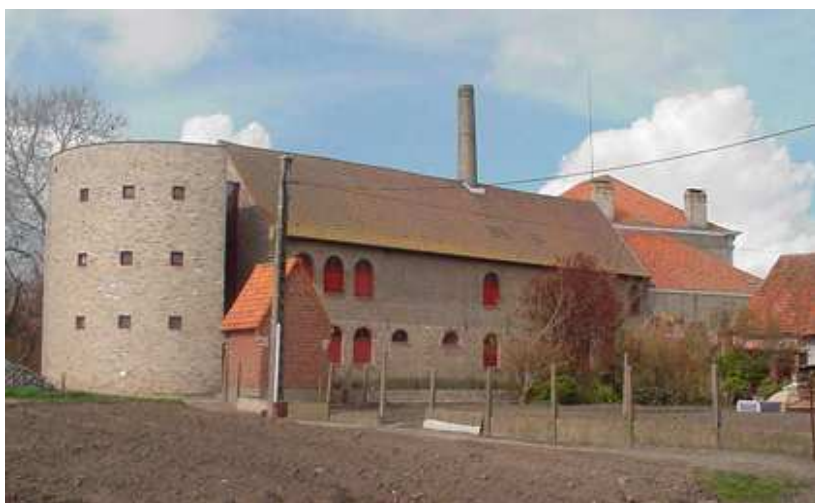
Fig. 01 – Het Mout- & Brouwhuis de Snoek (met expositietoren als nieuwbouwwitbreiding)

Net zoals op 4 juli l. houd ik er bij deze aan om ook via deze Brouwbuletin van het Mout- & Brouwhuis de Snoek iedereen die sinds het begin van dit erfgoedproject met ons gesympathiseerd heeft, van harte te danken. Zonder die sympathie en steun was het Mout- & Brouwhuis de Snoek nooit jongvolwassen geworden. Onder die vele pleitbezorgers hebben in de jaren volgend op die droom, een aantal zich als vrijwilligers vanuit hun specifieke kunnen in het bijzonder onderscheiden. Als voorzitter, die er intussen stilaan van droomt de fakkel door te geven aan de jonge generatie, wil ik – met het risico enkele personen te vergeten (maar wie geen risico's neemt, weet niet dat hij leeft) – in het bijzonder een aantal trouwe Het Brouwbuletin jaargang 1, 2009, nr 3 1