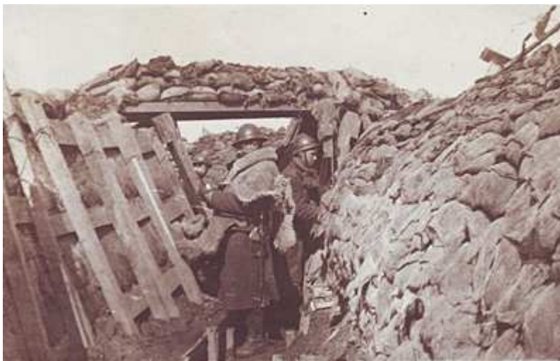
Fig. 09 - Soldaten aan het IJzerfront.